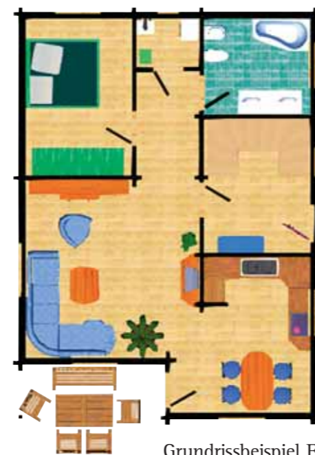
Grundrissbeispiel EG »Familienhaus«