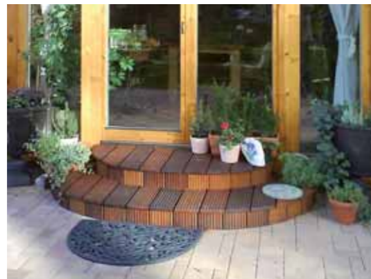
Terrassentür mit Holzpodest