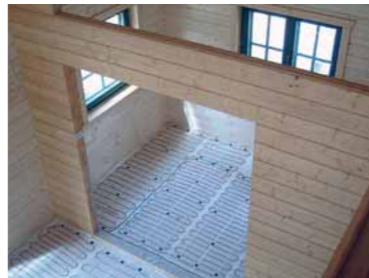
Vorbereitung für die Fußbodenheizung